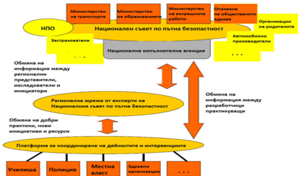
Фигура 2. Координация на системата за образование по безопасност на движението по пътищата

4. Информационният поток трябва да е двупосочен, за да се подобри способността за учене и времето за реакция на системата. Това означава, че координацията, изследванията и управлението трябва да общуват с практикуващите на място и обратно.