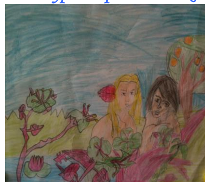
Рис. Румен от 5 а : „Раят”