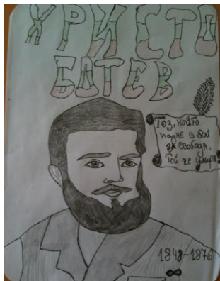
Рис. Данаил-76 клас